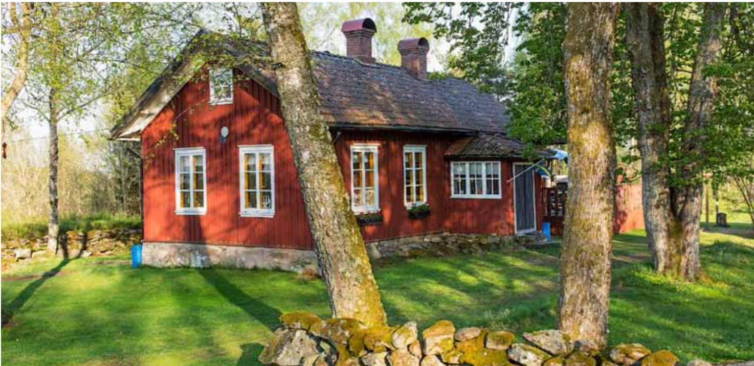
Den före detta småskolan i Senås (Surteby-Kattunga) från 1893 ser i stort sett ut som den gjorde i början av 1900-talet. Bilden till höger är ett klassfotografi taget på 1930- eller 40-talet. Vedboden med avträde (utedass) finns kvar än idag liksom en jordkällare som fungerade som lärarens kyllda skafferier före det att kylskåpet var uppfunnet. När skolan lades ner på 1940-talet så startade en syfabrik här med fyra anställda. Byggnaden är ett karakteristiskt exempel på hur folkskolor ofta utformades och placerades i slutet av 1800-talet.