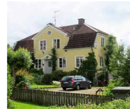
Lärarbostaden från 1935 vid Haby skola (Örby) har behållit mycket av sin ursprungliga karaktär och har ett högt kulturhistoriskt värde. Den är ett fint exempel på hur 1920-talets normalritningar för lärarbostäder kom att förverkligas. Äldre lärarbostäder ligger alltid i nära anslutning till en skola vilket vittnar om att det förr ansågs självklart att bo helt nära eller på sin arbetsplats. Det tidiga 1900-talets lärarbostäder är ofta ganska stora och påkostade villor som bekräftade lärarens höga status i samhället.

Lärarens hustru fick ingen lön men hon fanns ändå på plats som en viktig vuxen i skolmiljön. Lärarfrun vid Backens skola i Örbytrakten kunde plåstra om ett uppskrapat knä, ge en smörgås åt någon som inte alltid fick med sig ett matpaket hemifrån, och någon gång lagade hon ett byxben som fått en reva under lek.