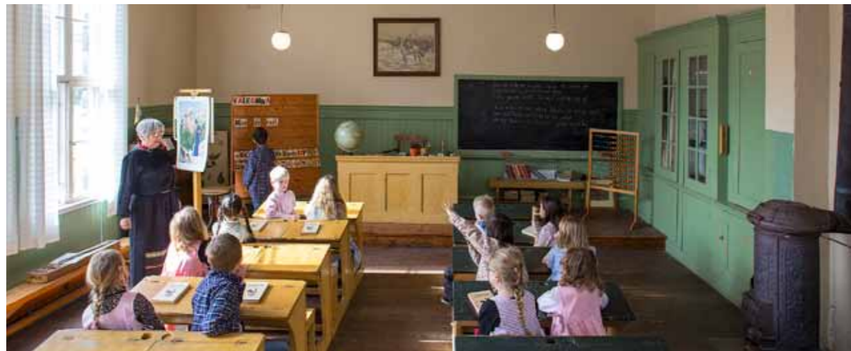
På Backens skola i Örby kan skolbarn idag få prova på hur det var att vara skolbarn under 1900-talets början.