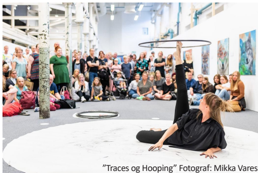
"Traces og Hooping"