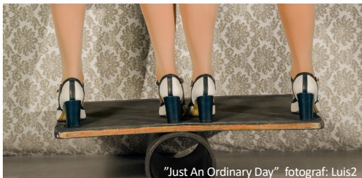
"Just An Ordinary Day"